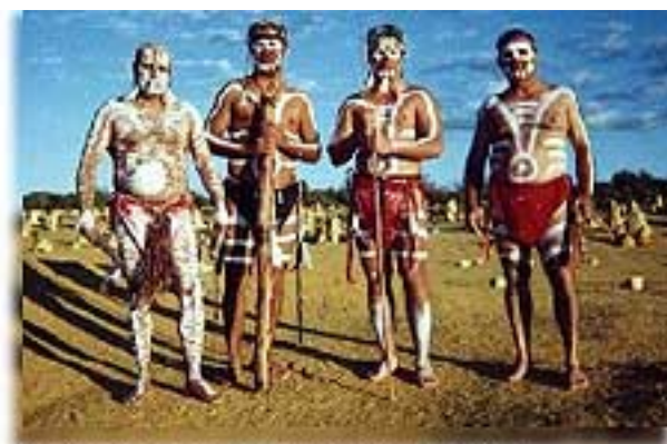
Aborígenes australianos. Tiempo mítico y tiempo real sin conflicto.

Adentrarse en el complejo mundo del mito y del ritual es emprender un camino sin retorno cuyo destino es desconocido para quien inicia el viaje. Aunque se disponga de mapa y brújula, es decir, las herramientas cognitivas y conceptuales que proporciona la Ciencia, el estudio y la experiencia de lo que mito y ritual transmiten suele afectar a las convicciones más profundas del viajero.